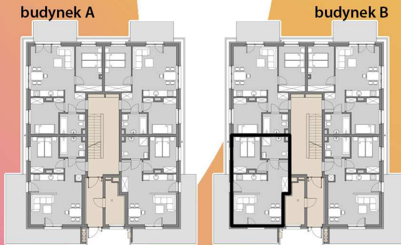
RZUTY KONDYGNACJI: PARTER